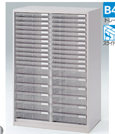
クリスタルトレイ型(下段用) HFM-128KBMN-□ □ ¥124,700 B4浅型トレイ24個 B4深型トレイ12個