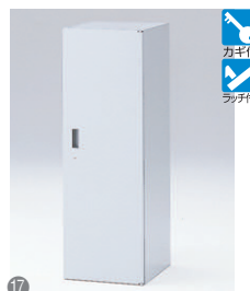
片開き扉型 GPN掲載 HFM-124HSS-□ □ ¥47,900 内寸法:W364×D415×H1136 棚板2枚付