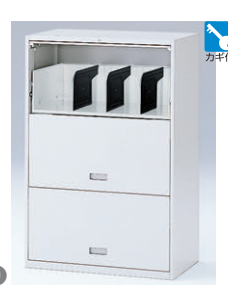
扉型 横式(下段用) GPN掲載 HFM-128BAN1-□ □ ¥110,600 内寸法:W719×D415×H330