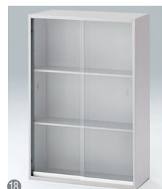
ガラス引戸型(上段用) HFM-128GSG-□ □ ¥64,500 内寸法:W763×D263×H1136 棚板2枚付、カギなし