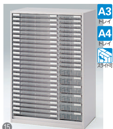
クリスタルトレイ型(下段用) HFM-128KATN-□ □ ¥132,000 A3横浅型トレイ24個 A4縦浅型トレイ12個、A4縦深型トレイ6個