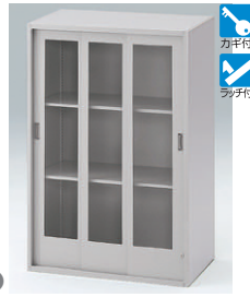
ガラス3枚引戸型(上段用) HFM-128RGN-□ □ ¥92,500 内寸法:W763×D401×H1136 棚板2枚付、扉自閉装置付