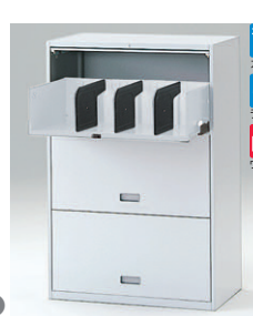
扉型引出し式(下段用) HFM-128CAN1-□ □ ¥125,600 内寸法:W719×D395×H330