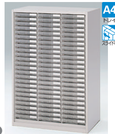
クリスタルトレイ型(下段用) HFM-128KADN-□ □ ¥151,300 A4縦浅型トレイ72個