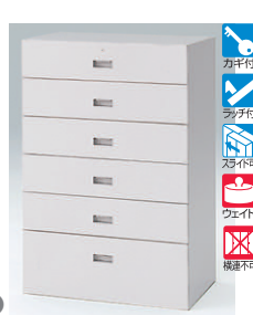
小引出しコンビ型(下段用) HFM-128AF1-□ □ ¥160,400 内寸法:上・中段 W720×D395×H142 最下段 W720×D401×H260