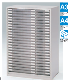
クリスタルトレイ型(下段用) HFM-128KARN-□ □ ¥141,200 A3横浅型トレイ24個 A4縦浅型トレイ24個