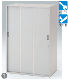
3枚引戸型 HFM-128RSN-□ □ ¥84,000 内寸法:W763×D401×H1136 棚板2枚付、扉自閉装置付