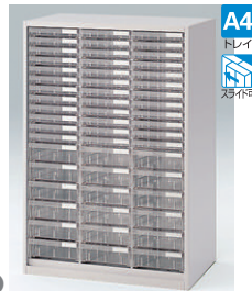
クリスタルトレイ型(下段用) HFM-128KAFN-□ □ ¥132,700 A4縦浅型トレイ36個 A4縦深型トレイ18個