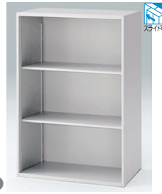
オープン棚型 HFM-128LS-□ □ ¥38,400 内寸法:W763×D448×H1136 棚板2枚付、棚板奥行寸法:D400