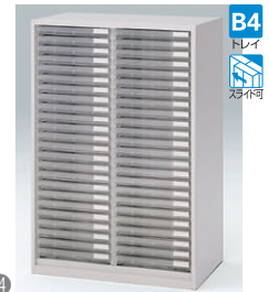
クリスタルトレイ型(下段用) HFM-128KBKN-□ □ ¥142,000 B4浅型トレイ48個