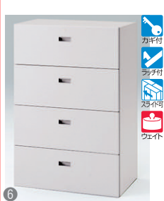
A4引出し型(下段用) GPN掲載 HFM-128AAS1-□ □ ¥113,000 A4フォルダー用引出し4段 内寸法:W720×D401×H260

写真番号①～⑥の製品は、棚板(HFM-008GA-□□)を1枚追加注文すれば、A4ボックスファイルを4段収納することができます。