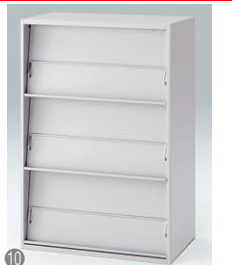
雑誌架型 HFM-128BHS-□ □ ¥101,100 内寸法:W762×D360×H288 扉部有効寸法:W742×D22×H363 カギなし