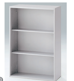
オープン棚型 HFM-128LS-□ □ ¥36,700 内寸法:W763×D298×H1136 棚板2枚付、棚板奥行寸法:D250