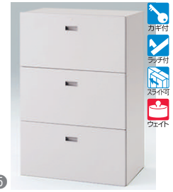
A3引出し型(下段用) GPN掲載 HFM-128ALS1-□ □ ¥97,100 A3フォルダー用引出し3段 内寸法:W720×D395×H358

写真番号①～⑥の製品は、棚板(HFM-008GA-□□)を1枚追加注文すれば、A4ボックスファイルを4段収納することができます。