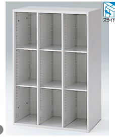
3列オープン棚型 HFM-128LC1-□ □ ¥81,600 内寸法:W242×D448×H1136(3列) 棚板6枚付、棚板最大積載質量:15kg 追加棚板 HFM-02T1-□ □ ¥2,600 棚板用見出し HFM-RE(10枚入) ¥1,600 ▶P.618参照