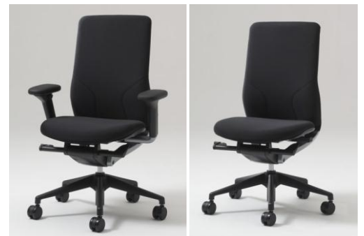
タスクチェア(左:肘付、右:肘なし)

シートの追従性が高く、実用性にすぐれたタスクチェア。操作がしやすい大き目のハンドルやボタン〈Usability Design(ユーサビリティ・デザイン)〉を採用しています。ワークスタイルに合わせて肘付・肘なしを選べるほか、クロスカラーはブラック、ライトブルー、イエローグリーン、オレンジの4色が揃っています。本体シェルカラー(樹脂)はブラック。