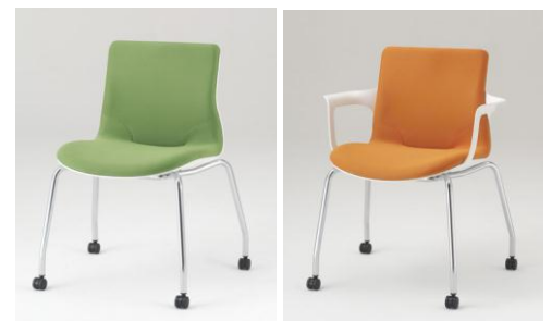
ミーティングチェア(左:肘なし、右:肘付)

座り心地を意識したデザインで、会議用やゲストチェアに最適。キャスター付きで快適な可動性も備えています。肘付・肘なしタイプがあり、クロスカラーはタスクチェアと同色のブラック、ライトブルー、イエローグリーン、オレンジの4色からお選びいただけます。本体シェルカラー(樹脂)はホワイト。